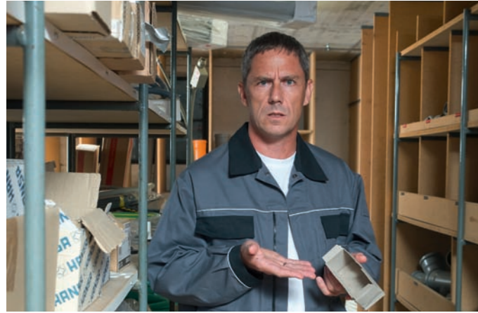
Das passiert Ihnen momentan vielleicht auch...