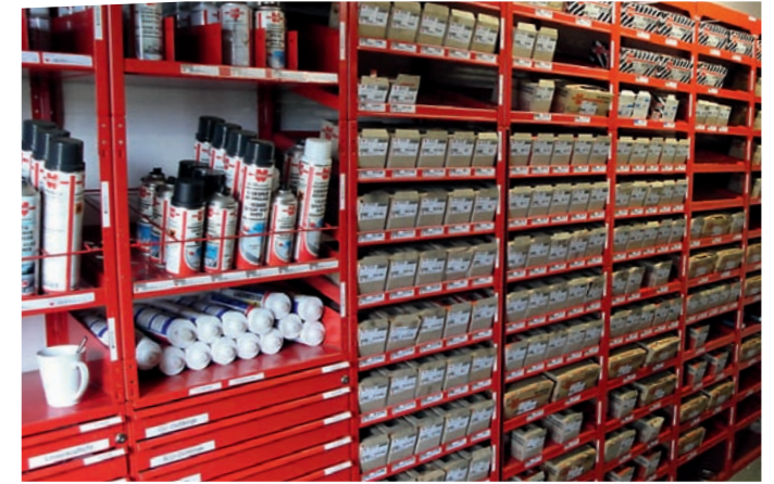
...mit dem ORSY® Regalsystem nicht mehr!